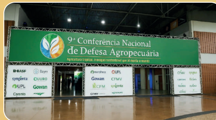
Pórtico de Entrada