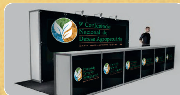
Balcão de Secretaria/Credenciamento