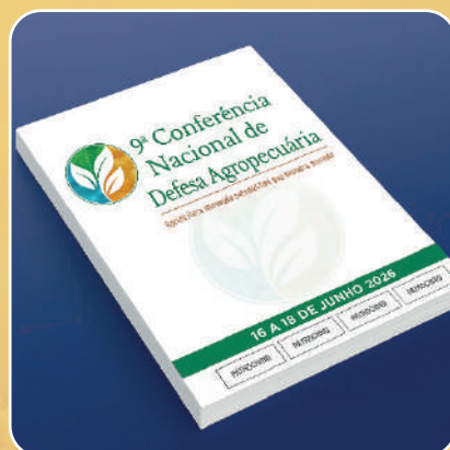
Bloco de Anotação