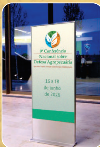
Painel de Sinalização