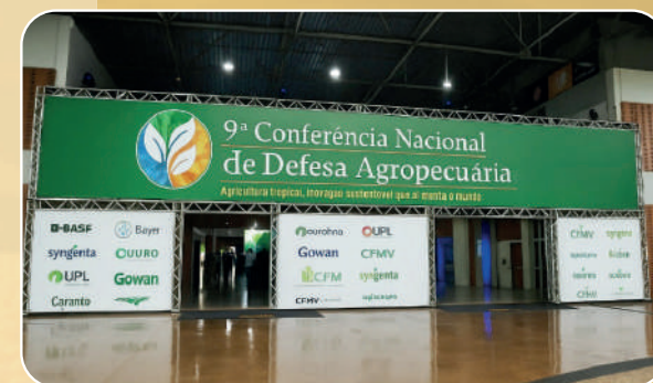
Pórtico de Entrada