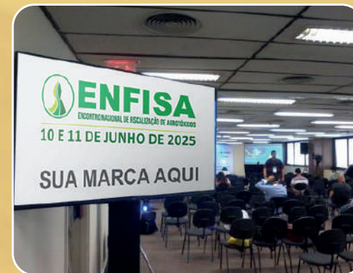
TV de LED