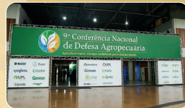
Pórtico de Entrada