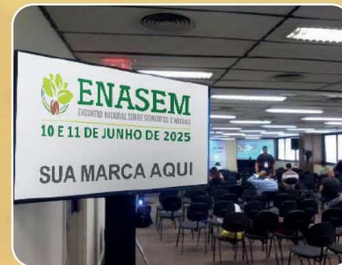
TV de LED

Para mais informações sobre a proposta de patrocínio, entre em contato com a Minasplan e descubra as inúmeras vantagens de associar sua empresa a este prestigiado evento técnico.